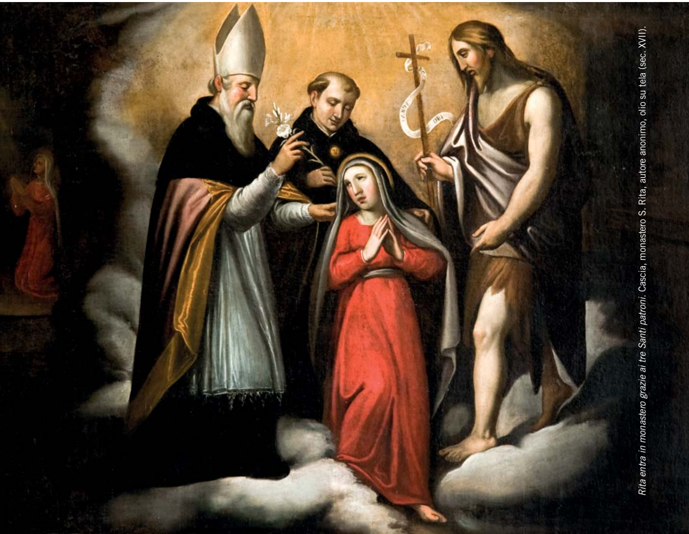
Rita entra in monastero grazie ai tre Santi patroni. Cascia, monastero S. Rita, autore anonimo, olio su tela (sec. XVII).

no anche tutta l'interpretazione: compresa quella che fa di Santa Rita una donna che vola "sulle scope"! Da dove, dunque, proviene questo volo? Forse è semplicemente l'interpretazione popolare della tela secentesca che rappresenta i tre Santi patroni e Rita tra le nubi (le nubi non mancano mai nelle apparizioni). Le interpretazioni spariscono come la nebbia al