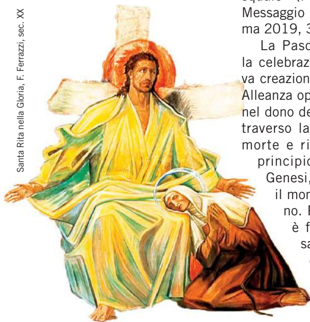
Santa Rita nella Gloria, F. Ferrazzi, sec. XX

La Pasqua è primavera di vita. L'inverno e il buio del male e del peccato sono passati, la grazia, la gioia, la vita portati dalla primavera di Cristo hanno vinto il grigiore dello sconforto e i colori luminosi della Risurrezione ir-