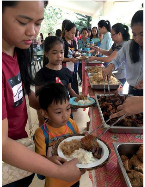
Tanti giovani al primo pranzo di Natale a Bulacan.

“Le offerte che abbiamo ricevuto dai tanti benefattori, si sono concretizzate in