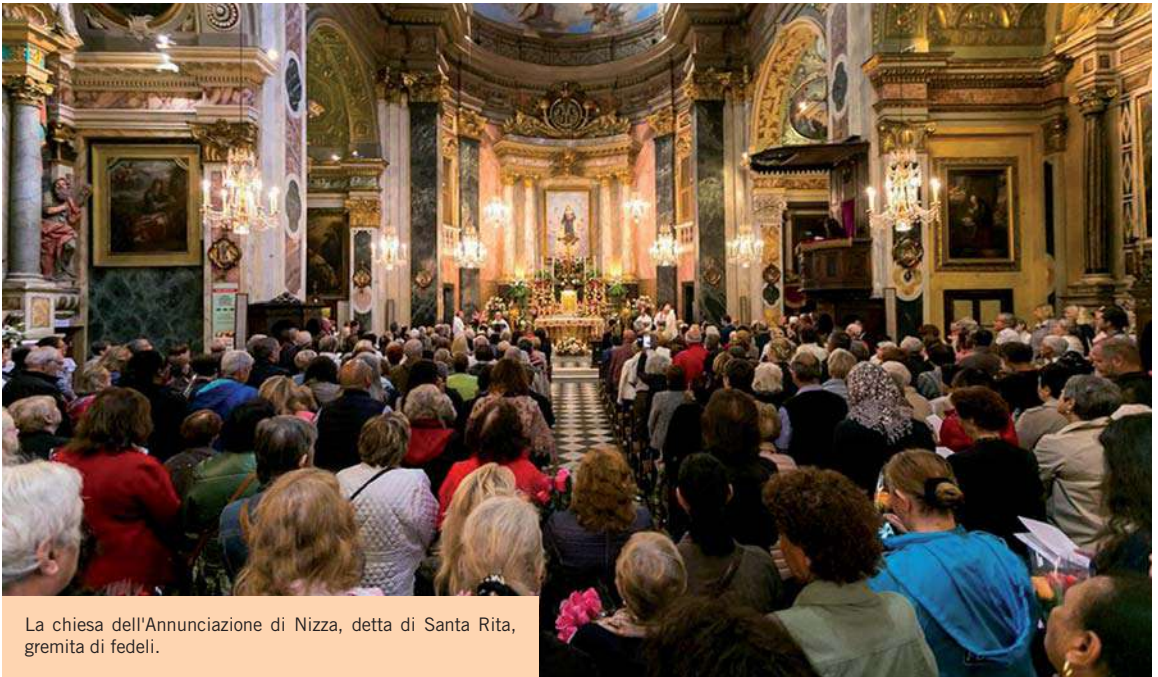
La chiesa dell'Annunciazione di Nizza, detta di Santa Rita, gremita di fedeli.

Giovedì di Santa Rita”, durante i quali si rivolgono preghiere alla taumaturga e si ricordano momenti della sua vita; la Novena, una Messa il 21 maggio con la lettura delle preghiere di intercessione, e una grande celebrazione nel giorno a lei dedicato, trasmessa anche attraverso il sito web della parrocchia e la pagina Facebook. Strumenti, questi ultimi, che i Padri Oblati utilizzano come estensione di ciò che accade nel Santuario, per arrivare anche a coloro che il santuario non possono raggiungerlo. Un gruppo di laici supporta i Padri nella gestio-