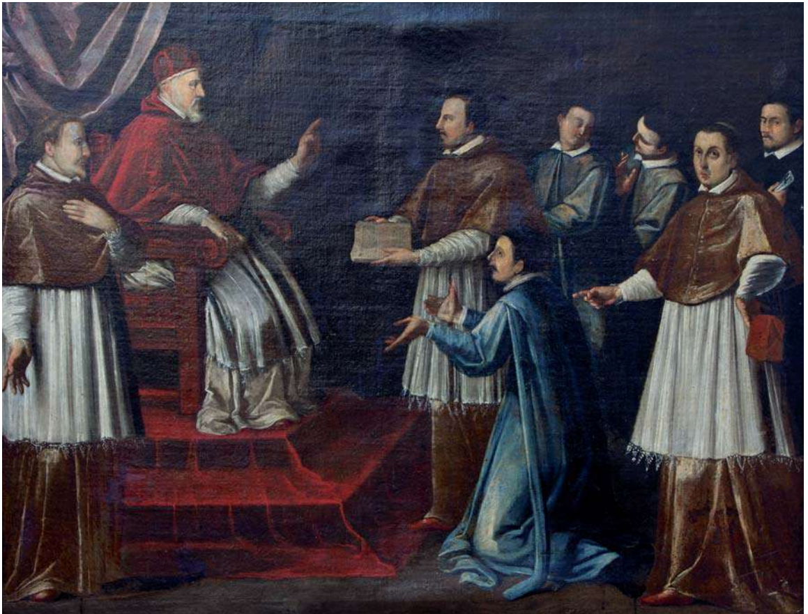
Urbano VIII riceve e approva il processo per il riconoscimento del culto di Santa Rita. Cascia, Monastero di Santa Rita, autore anonimo (sec. XVII)

perché mai, crescendo, avessero cercato di vendicare il padre. I due ragazzi non ebbero neppure il tempo di covare sentimenti di vendetta perché, mentre Rita era ancora in lutto per il marito, entrambi morirono, forse a causa delle ricorrenti pestilenze che decimarono l'Europa a partire dal XIV secolo.