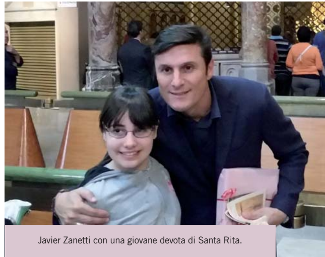
Javier Zanetti con una giovane devota di Santa Rita.

«La sera prima (della Champions League 2010, ndr), a mezzanotte, ho acceso una candela...» mi racconta lui «Mentre dormivamo, ci accompagnava. Io ero con il mio compagno di stanza Ivan Cordoba, un grandissimo amico, e questa candela accesa ci faceva compagnia... Per tutta la notte, per tutta la partita, per tutti i momenti». Così mi spiega che lui, il grande Javier Zanetti, non era l'unico giocatore dell'Inter ad essere un devoto di Santa Rita da Cascia: «C'era anche Diego Milito, che indossava la maglia numero 22 e ha realizzato 2 goal durante quella finale». E racconta che alla Pinetina, il centro sportivo dell'Inter, «la famiglia Moratti aveva costruito una chiesa e lì abbiamo anche una statua di Santa Rita che avevamo portato noi. Sicuramente, nello sport, la mia fede mi ha accompagnato sempre. La fede mi ha dato grandissima forza» in campo e fuori dal campo, penso io ad alta voce. «Fuori, però» precisa lui «sono davvero sempre stato normale». Parola che ripete più volte, normale , perché ci tiene a