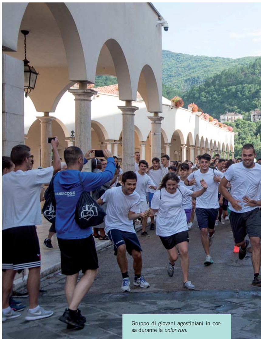
Gruppo di giovani agostiniani in corsa durante la color run .

T ra i molti scritti di Sant'Agostino se ne trova uno dal titolo abbastanza originale, De agone christiano . Agon indica, prima in greco e poi anche in latino, la gara di lotta che si svolge, come attività sportiva che attira molto pubblico, in una piazza; potremmo dunque provare a tradurre il titolo come "Il combattimento cristiano", tenendo però presente che si tratta di un combattimento sportivo (appunto agonistico!) e non militare. Agostino si sta dunque servendo della metafora sportiva per illustrare il cammino della vita cristiana alle persone semplici, dei quali era da poco divenuto vescovo (se davvero lo scritto risale al 397, come sembra) e che, come ricorderà lo stesso Agostino, avevano difficoltà a comprendere un latino elaborato, tanto che egli si sforza di conservare un linguaggio semplice e di essere breve, proprio per non affaticare gli ascoltatori e lettori. Siamo quindi davanti a un manuale che vuole illustrare come si vive cristianamente, e che lo fa proponendo la sequela del Salvatore come una specie di gara; in effetti, nota il santo vescovo, a noi è promessa una corona; questa era il tro-