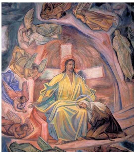
Basilica di Santa Rita da Cascia. F. Ferrazzi, Santa Rita nella Gloria (sec. XX).

Ai nostri giorni, invece, la modernità ci ha abituato a una specie di "culto" della velocità: l'alimentazione all'insegna del fast food , i mezzi di trasporto sempre più veloci, la possibilità di connettersi immediatamente con tutti, accorciando ancora le distanze. Ovviamente, non vogliamo star qui a lamentarci di tutto: che spostarsi e comunicare, come anche cucinare o anche semplicemente svolgere lavori domestici e professionali siano diventati processi che richiedono meno tempo è senz'altro qualcosa che va