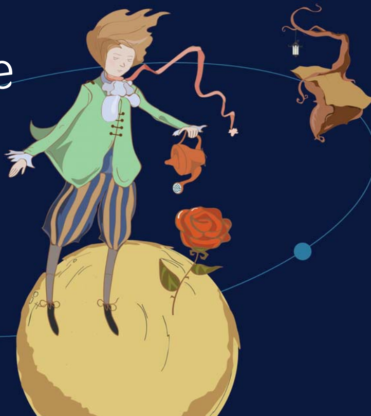
Raffigurazione del Piccolo Principe, protagonista del romanzo omonimo di Antoine de Saint-Exupéry.