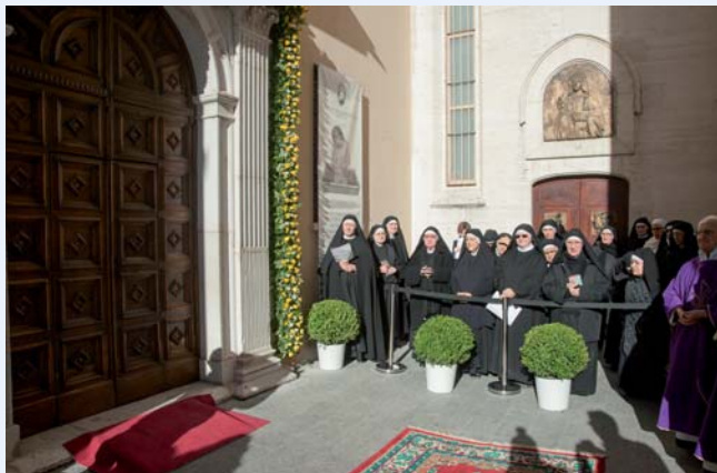
La Comunità del Monastero Santa Rita, durante il rito d'apertura della Porta Santa al Santuario di Santa Rita da Cascia, il 20 dicembre 2015.