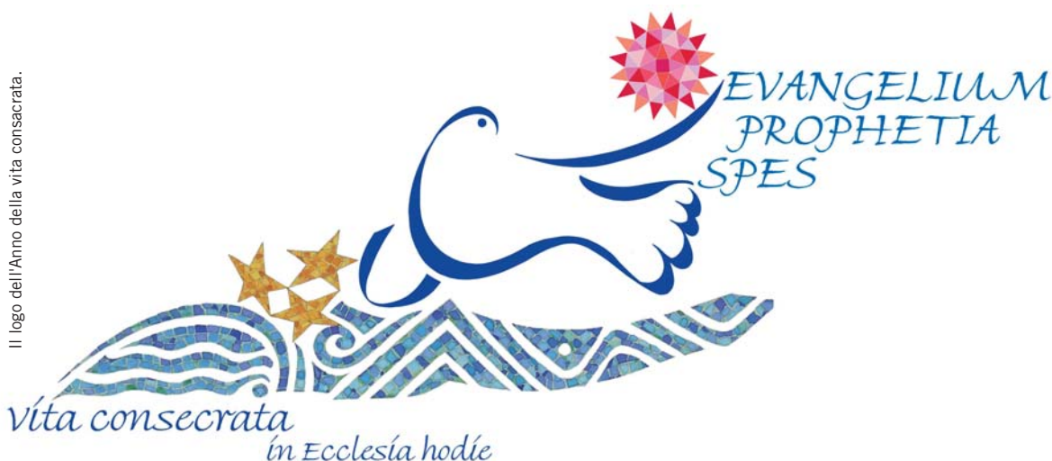
Il logo dell'Anno della vita consacrata.

verso le periferie esistenziali, pur rimanendo in clausura. Ho sempre avuto la convinzione della necessità di avere una profonda vita interiore. Cristo sempre al centro del cuore, al primo posto, il confronto sempre e solo con Lui dedito al Padre nella preghiera, nel silenzio, nell'abbandono totale