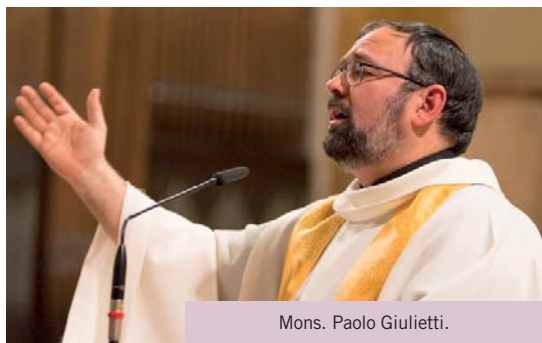
Mons. Paolo Giulietti.

Mons. Paolo Giulietti, vescovo ausiliare dell'Arcidiocesi di Perugia-Città della Pieve, risponde alle domande di Rita Gentili