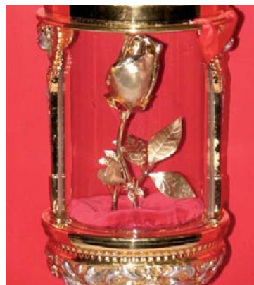
Dal 2007 a oggi, sono molte le città che hanno accolto la reliquia di Santa Rita.

rio di poter avere in diocesi il dono prezioso di una reliquia insigne della Santa, dato che era seriamente intenzionato di proporre una missione popolare nel paese tanto conosciuto di San Luca, dove da qualche tempo regnava l'odio e la violenza. I frati e le Monache accolsero subito e con gioia la richiesta, mettendosi così all'opera per realizzare un reliquiario che potesse contenere un pezzo di osso del corpo di Santa Rita. Le Monache più anziane si ricordarono che in una delle ultime ricognizioni, erano stati asportati dal corpo di Rita tre ossicini, custoditi gelosamente all'interno del Monastero. Nessuno però si ricorda da quale parte del corpo sono stati asportati. Grazie a una successiva analisi eseguita da un esperto della Parrocchia SS. Annunziata di Torre del Greco, in provincia di Napoli, siamo riusciti a conoscerne la provenienza: si tratta del metacarpo