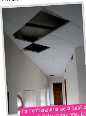
La Penitenzieria della Basilica aveva urgente necessità di ristrutturazione. Ecco com'era nel 2014.