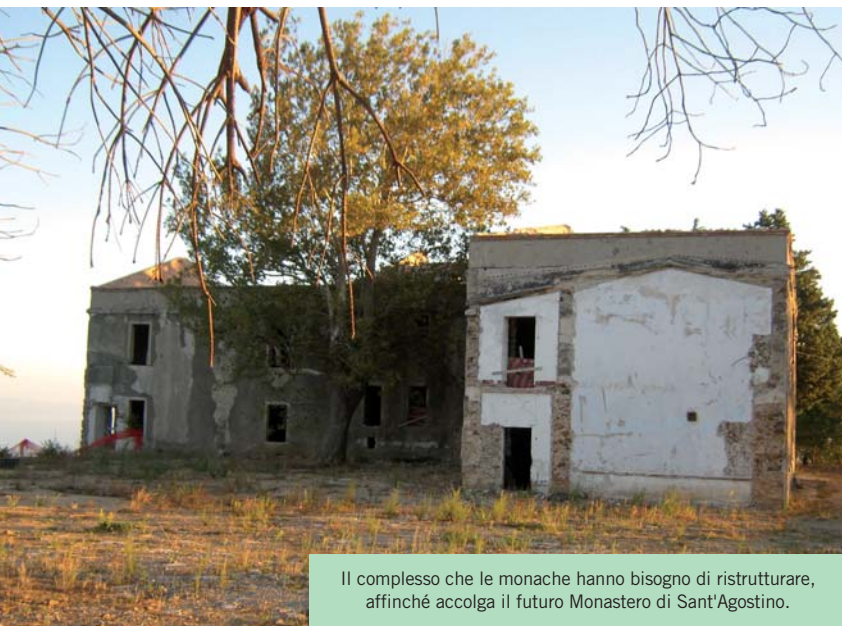
Il complesso che le monache hanno bisogno di ristrutturare, affinché accolga il futuro Monastero di Sant'Agostino.

La vita consacrata è una questione personale o ecclesiale? La vita consacrata è un dono prezioso di Dio alla Chiesa; i consacrati sono chiamati, per volontà di Dio, ad esprimere lo stile di vita di Gesù e a ricordare a tutti che il nostro umano andare ha un destino, una meta: l'abbraccio amorevole di Dio, forte e duraturo quanto l'eternità! Ecco allora perché salutiamo come provvidenziale l'anno dedicato alla vita consacrata (il 2015, ndr): vi cogliamo un'occasione stupenda per rinnovare il nostro amore a Cristo e la nostra dedizione al Vangelo.