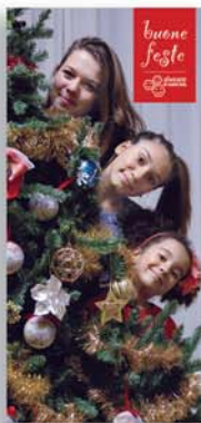
cod. A Biglietto d'auguri Alveare (cartolina fronte/retro, cm 10x21, con busta inclusa) contributo unitario: 1€

Per un Natale con Santa Rita, regala e regalati uno dei prodotti solidali della linea "Fatto per amore". Scegli così di sostenere le opere caritatevoli che le monache del Monastero Santa Rita portano avanti per i più indifesi. Puoi trovare questi e altri prodotti nella versione completa del catalogo su www.santaritadacascia.org/natale