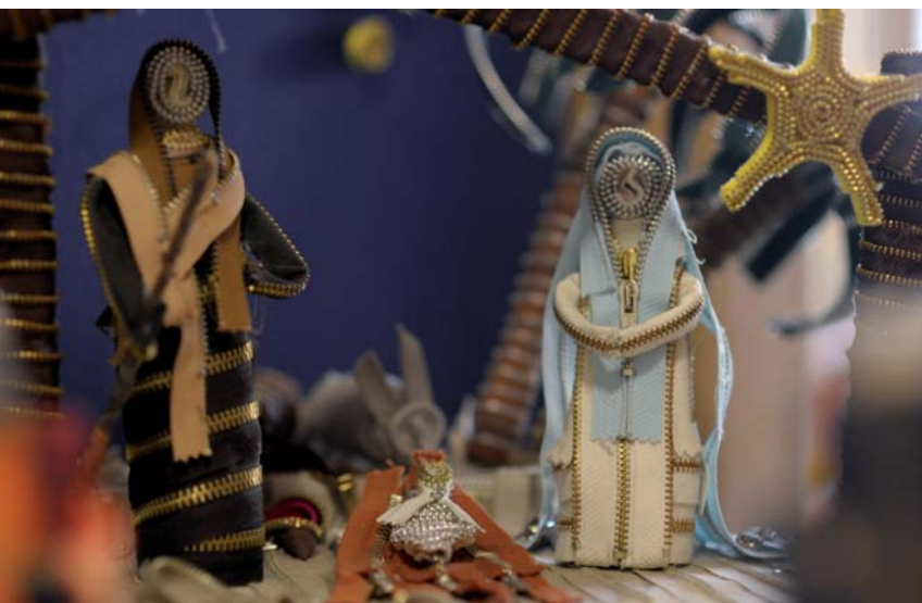
Rappresentazione della Santa Famiglia, realizzata dall'Alveare di Santa Rita, la casa del Monastero Santa Rita che accoglie minori in disagio.

re il loro bambino, Giuseppe e Maria scappano in una notte di paura e incertezze. Il nostro Santo Padre Francesco ci ricorda: «Mentre fissiamo lo sguardo sulla santa Famiglia di Nazareth nel momento in cui è costretta a farsi profuga, pensiamo al dramma di quei migranti e rifugiati che sono vittime del rifiuto e dello sfruttamento, che sono vittime della tratta delle persone e del lavoro schiavo. Ma pensiamo anche agli altri "esiliati": io li chiamerei "esiliati nascosti", quegli esiliati che possono esserci all'interno delle famiglie stesse: gli anziani, per esempio, che a volte vengono trattati come presenze ingombranti (Angelus, Festa della Santa Famiglia 2013)» . L'annuncio del Vangelo, infatti, passa anche e soprattutto dalle famiglie. Papa Francesco ci dà molti spunti per riflettere in proposito: «Gesù ha voluto appartenere ad una famiglia che ha sperimentato queste difficoltà, perché nessuno si senta escluso dalla vicinanza amorosa di Dio... Dio è là dove l'uomo è in pericolo, là dove l'uomo soffre, là dove scappa, dove sperimenta il rifiuto e l'abbandono; ma Dio è anche là dove l'uomo sogna, spera di tornare in patria nella libertà, progetta e sceglie per la vita e la dignità sua e dei suoi familiari» . ■