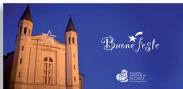
cod. B Biglietto d'auguri Basilica (cartolina fronte/retro, cm 21x10, con busta inclusa) contributo unitario: 1€