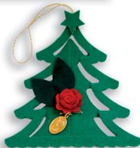
cod. D Alberello della festa (in feltro, cm 13,5 ca., con medaglietta di Santa Rita) contributo unitario: 6€