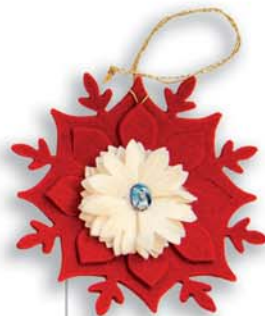
cod. E Fiocco di neve (in feltro, cm 13 ca., con immaginetta di Santa Rita) contributo unitario: 6€

Compila questo modulo e spediscilo, allegando copia della ricevuta di avvenuto versamento, tramite: